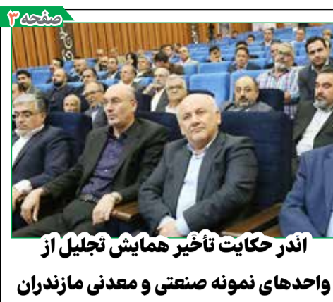
اندر حکایت تأخیر همایش تجلیل از واحدهای نمونه صنعتی و معدنی مازندران