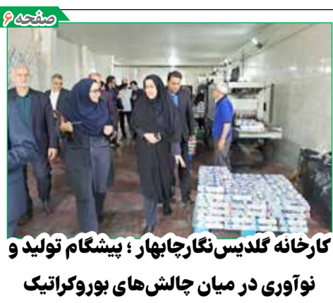
کارخانه گلدیس نگار جابه‌ار؛ پیشگام تولید و نوآوری در میان چالش‌های بوروکراتیک